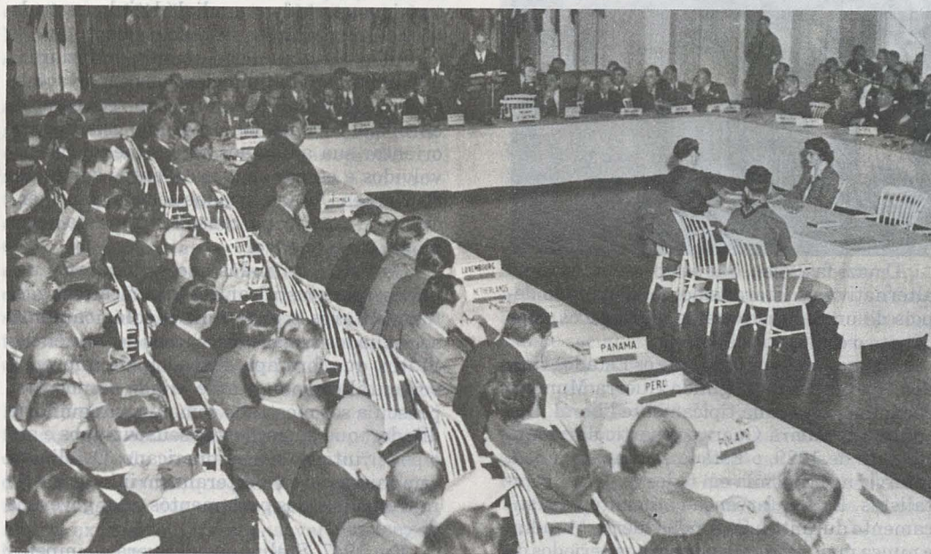
A Conferência de Bretton Woods, em julho de 1944, traçou as linhas da economia do pós-guerra, tendo o dólar como eixo e instituições, como o FMI e Banco Mundial, na função de instrumentos

A consolidação dos Estados Unidos como superpotência nos anos posteriores ao conflito mundial está em crise, dando origem a um cenário multipolar, que projeta para um futuro não muito longínquo o surgimento de uma civilização planetária