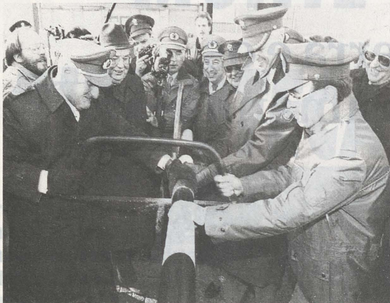
Guardas holandeses e alemães serram a cancela da aduana, na fronteira entre os dois países, em 1º de janeiro de 1993, quando se consumou a Comunidade Européia

O nazi-fascismo, que se apresentara como alternativa ao liberalismo, foi derrotado depois de um fantástico auge durante os anos 30, até o começo dos anos 40.