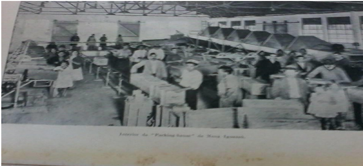
Imagem 01: fotografia do interior de um “Packing House” em Nova Iguaçu.