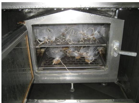
Figura 4. Sementes acondicionadas no interior da câmara, embaladas em tecido permeável

Foram separadas nove amostras para cada tratamento, contendo 100 sementes cada. As sementes foram embaladas em tecido permeável permitindo a interação entre as condições de temperatura e umidade no interior da câmara de envelhecimento. A temperatura utilizada foi de 40°C e 100% de umidade relativa no interior da câmara. Os intervalos de tempo estabelecidos foram de 0, 4, 8, 24, 32, 48, 72, 96 e 144 horas. A cada intervalo de tempo, uma amostra de cada tratamento era retirado da câmara e procedido o teste de germinação a temperatura de 30° C.