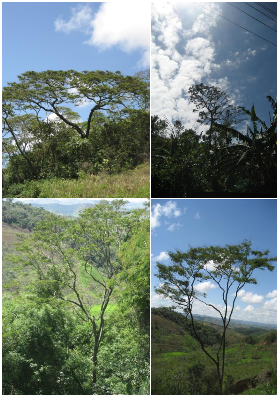
Figura 2. Imagem de quatro matrizes selecionadas da espécie M. artemisiana , Barra do Piraí – RJ.

Procedida à coleta, as sementes foram beneficiadas manualmente, separando-se impurezas e sementes danificadas, obtendo um lote homogêneo. Feita a coleta, o material foi encaminhado para análise ao Laboratório de Biologia Reprodutiva e Conservação de Espécies Arbóreas (LACON) na UFRRJ.