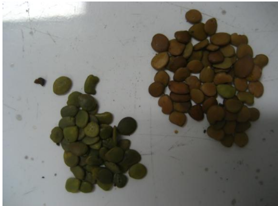
Figura 3. Sementes imaturas e sementes maduras de M. artemisiana

As sementes foram classificadas em sementes maduras e imaturas, de acordo com sua coloração e rigidez. As sementes imaturas possuíam coloração esverdeada, e se apresentavam pouco rígidas. Já as sementes maduras tinham coloração marrom e apresentavam certa resistência quando submetidas à ação mecânica.