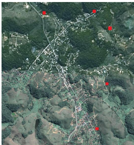
Figura 1. Imagem da área de coleta, Barra do Piraí- RJ. Coordenadas 22°22'30.13''; 22° 22' 12.10'' latitude S e 43°51'41.95''; 43° 52' 37.36'' longitude W. Destaque para pontos de localização das matrizes de Mimoso Artemisiana (Heringer & Paula) Fonte: Google Earth ( 14/09/ 2010).

A área de coleta de sementes tem como coordenadas geográficas 22°22'30.13''; 22° 22' 12.10'' latitude S e 43°51'41.95''; 43° 52' 37.36'' longitude W. e está localizada na região hidrográfica do médio Paraíba do Sul, no município de Barra do Piraí, Estado do Rio de Janeiro. O clima da região é Cwa, segundo Koeppen, como mesotérmico úmido com média do mês mais frio inferior a 18°C e mês mais quente com temperatura superior à 22°C, com estação seca no inverno e precipitação média anual de 1.259,9 mm (SPOLIDORO, 2001). A vegetação de ocorrência na área de estudo é a Floresta Estacional Semidecidual (VELOSO, et al. ,1991). A região apresenta altitude próxima aos 730 metros do nível do mar.