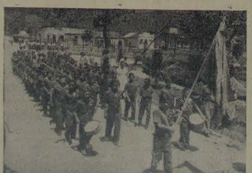
Crianças do Clube dos 4-E, quando desfilavam garbosamente pela Praça Barão de Tinguá