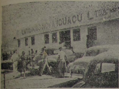
A Usina Laticínios Nova Iguaçu, sítio na av. cel. Fren.º Soares