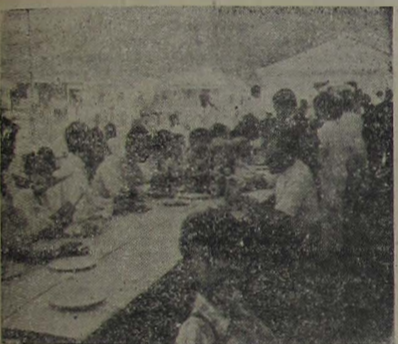
Aspecto do grande charrasco quando da inauguração da Usina