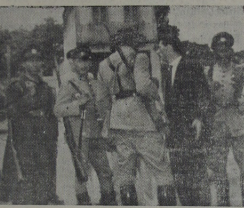
Dois aspectos das eleições nos Municípios de Caxias e S. João de Meriti, vendo-se em cima uma senhora quando votava, trazendo o filho ao colo e, em baixo, parte do reforço policial.