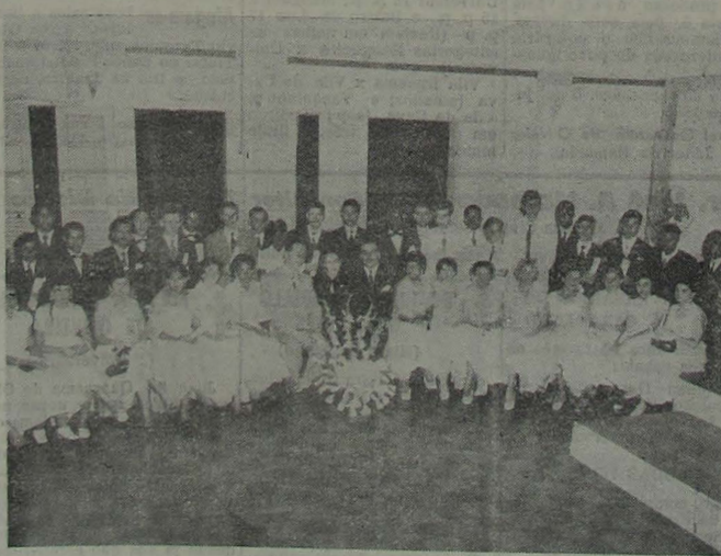
NOVOS DATILÓGRAFOS DO GINÁSIO IGUAÇUANO. — Vêem-se no clichê, juntamente com seu parâmetro e o diretor do estabelecimento de ensino, os novos datilógrafos da 1ª turma deste ano, quando da solenidade em que receberam os seus diplomas, no dia 2 do corrente, na sede do E. C. Iguaçu. (Noticiário na 7ª página).

Muito ainda falta escrever (Conclua na 7ª página)