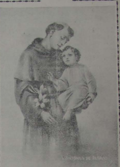
Em louvor a Santo Antônio de Jacutinga, hoje, em Nova Iguassú, realizam-se imponentes festividades, entre as quais devem sobressair a missa soene das 10 horas...