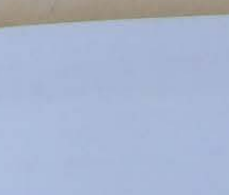
Passeata dos órfãos do Vivenda da Luz

FESTAS Aceitam-se encomendas de doces, salgadinhos, bolos, balas, mesas infantis e bandejas decoradas. Travessa Quaresma, 35 Apt. 101 - Nova Iguaçu