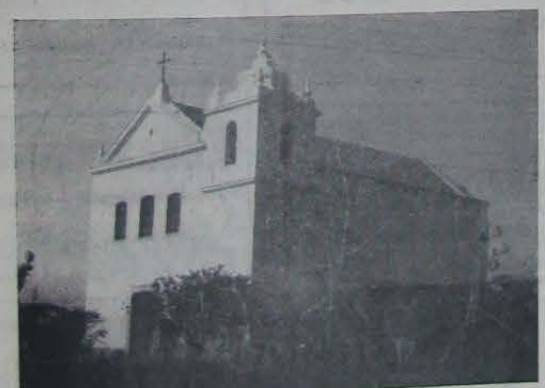
A igreja Matriz de Jacutinga (Prata), encontrada em ruínas pelo vigário João Müsch quando aqui chegou em fins de 1929, hoje totalmente reformada.

Aos 25 do mez de março do anno do Nascimento de Nosso Senhor Jesus Christo de 1863 nesta povoação de Maxambomba desta freguezia de