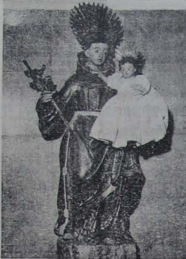
A linda imagem do glorioso padroeiro de Nova Iguassu, Santo Antônio de Jacutinga, de madeira e no estilo barroco.

"Dou commissão ao reverendo vigário da freguezia de Santo Antonio de Jacutinga do termo da villa de Iguassu para rubricar este livro que é destinado para se lavrarem