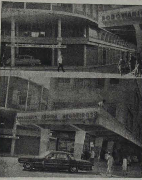
Na fotomontagem vemos, em cima, vista parcial do Centro Comercial "Oswaldo Mendes de Oliveira", verdadeira jóia arquitetônica. Em segundo plano, o Rodoviário "Arruda Negreiros", em cuja parte superior aparecem dois andares onde funcionará a Prefeitura Municipal. (Foto Valdêr Leitão).

CRESCIMENTO horizontal de Nova Iguaçu está verdadeiramente ultrapassado. No momento o Município cresce para o alto e o majestoso Cent. Com. "Oswaldo Mendes de Oliveira" é bem uma demonstração do que afirmamos. O empreendimento tornou a av. Nilo Peçanha uma das mais bel. s, funcionais e bem movimentadas artérias da cidade.