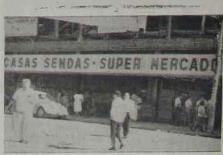
A grande loja das Casas Sendas — Supermercado é bem um atestado de desenvolvimento do comércio de Nova Iguaçu, a qual veio trazer grande benefício à nossa coletividade.

Com a presença das mais destacadas figuras do mundo comercial, social e político deste Município, foi brilhantemente inaugurada sexta-feira última a filial das famadas "Casas Sendas", ótima mente instalada na av. Nilo Peçanha, 197, em frente ao Centro Comercial "Oswaldo Mendes de Oliveira".