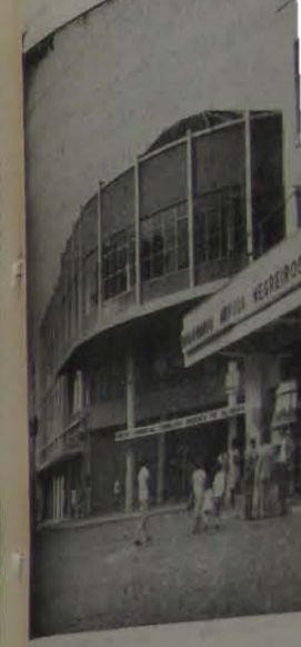
O Centro Comercial "Guilherme Mendes de Oliveira", onde a