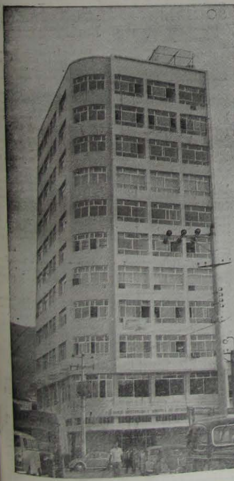
O Edifício das Profissões Liberais é uma das gigantescas obras do grupo Oswaldo, Artur e Braid. É o mais alto da cidade (Reportagem na 3ª página)