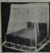
DIXIE à noite

Rua 13 de Maio, 85 - G. 201 - Tel. 2792 - N. Iguaçu Em frente ao Rodoviário Getúlio Moura