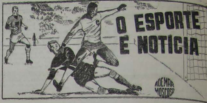
vo principal é defender e divulgar o nosso desporto e não desmoralizá-lo. Esperamos que a direção da LID e a JDD continuem este trabalho de saneamento para o bem estar do desporto iguassuano.