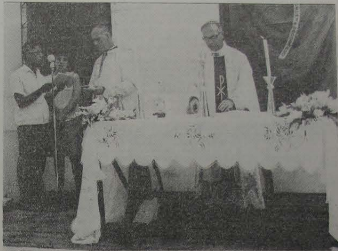
Dom Adriano Hipólito quando oficiava a Missa Campal, em altar armado em frente do Banco do Brasil.

Projeto-se notavelmente na vida pública. Foi por várias legislaturas, de 1903 a 1909, Deputado à Assembleia Legislativa do Rio de Janeiro; de 1909 a 1923 atuou como Deputado Federal representante deste Estado; e exerceu o posto de Governador do Estado do Rio de Janeiro.