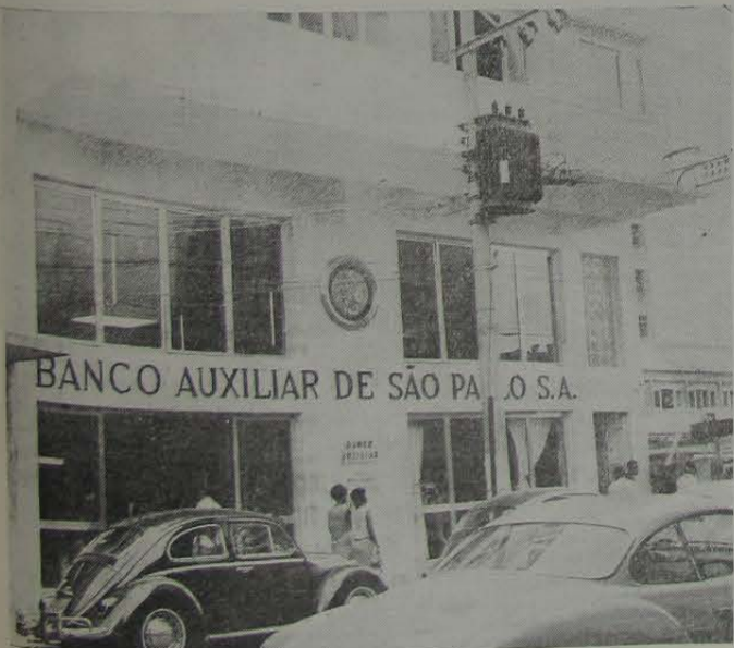
Esta é a fachada da nova sede própria do importante estabelecimento bancário, onde haverá "sempre uma porta aberta" para todos.

Presentes as mais destacadas figuras do mundo comercial e social do Município. (Página 3)