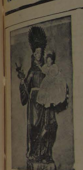
A linda imagem de Santo Antônio de Itatinga, que hoje é reverenciada por milhares de fiéis.