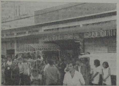
Pessoas de várias camadas sociais foram assistir à inauguração da bonita casa comercial.

Presentes o Prefeito e outros convidados ilustres. — Ambiente acolhedor. — (Leia na pág. 2)