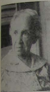
A. A. Filhos de Iguaçu