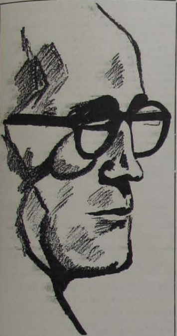
LITERATURA BRASILEIRA MODERNISMO

Sêro Verde Sêro Azul As duas fazendas de meu pai aonde nunca fui Miragens tão próximas pronunciar os nomes era tocá-las