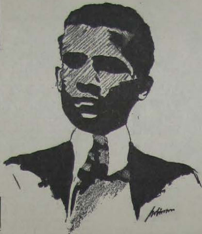
LITERATURA BRASILEIRA MODERNISMO

Nasci sem dinheiro, mulato e livre — revelaria mais tarde Lima Barreto, numa época em que a vida se lhe parecia a pior das madrastras, bem pior mesmo do que fazia supor as referências de sua origem.