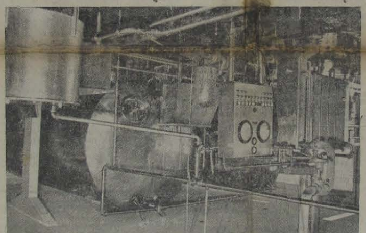
Éis os tanques onde é pasteurizado o Leite Vigor