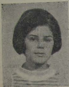
3º Normal 1º lugar da Escola Normal — Português e Literatura. Aprovada entre os alunos que disputaram as 40 vagas na U. E. G.