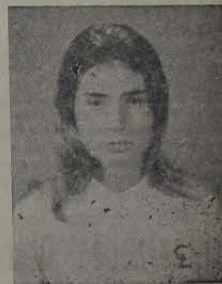
1º lugar do Colégio 2º ginástica