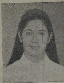
RAINHA DA SIMPATIA 1º científico