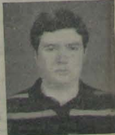
Bi-campeão de Xadrez 32ª OLIMPIADA 1º científico