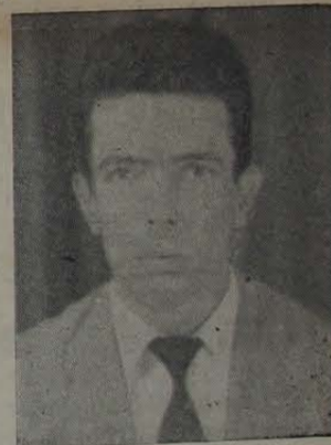
Ao querido aluno, professor e incondicional amigo, a homenagem de carinho e saudade da Casa de Leopoldo