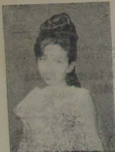
MISS PRIMÁRIO 1º lugar da turma 2º ano A