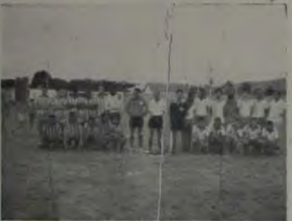
As seleções NORTE e SUL do "Campeonato da Mocidade" posando para a objetiva do nosso companheiro Milton de Almeida Lima.

TACA EFICIENCIA — De acordo com o regulamento, o Marajara é líder na eficiência, com 146 pontos, seguido de perto pelo V. Iracema com 144, ficando nas colocações seguintes: N. Aurora 136, Shangri-lá 114, Cadete 106, Banguzinho e Xavante 92, Ipiranga 73, J. Tropical 63, Progresso 55, Arcozele e V. Maia 52 e Ipiranga-GB 24.