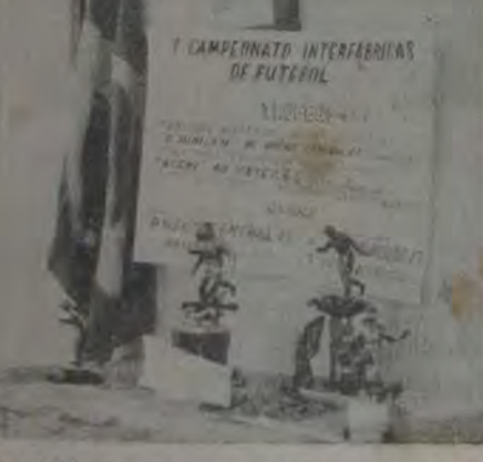
Foto de uma reunião para elaboração do regulamento do Campeonato Interfábricas de Futebol. O regulamento já esboçado será no dia 5 de março próximo, a partir das 20 horas, na sede da entidade organizadora. Na foto os primeiros oferecidos pela ACENI aos campeões do I Campeonato Interfábricas.

Uma das promoções da ACENI que teve grande repercussão neste Município foi o Campeonato de Futebol Interfábricas. Dos três realizados participaram indústrias do mais alto gabarito neste Estado, como: Pneus General (triângulo), Bayer Ustra Mecânica Carioca, Compactor, Forjas Brasileiras e outras. Em todos os certames camareou-se a entidade organizadora em oferecer aos vencedores troféus de consideráveis valores aquisitivos, sem visar qualquer parcela de lucro, gastando exclusivamente do seu. Este ano, com o "Influm" previsto para a primeira semana de abril, a ACENI vai organizar o IV Campeo-