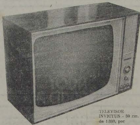
TELEVISOR INVICTUS - 59 cm. de 1.080, por 590,