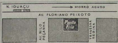
R. MAL. FLORIANO PEIXOTO, 2.024