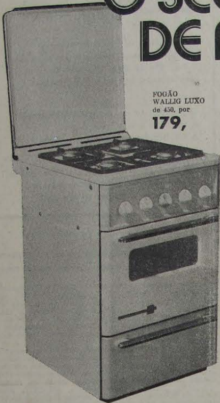
FOGÃO WALLIG LUXO de 450, por 179,