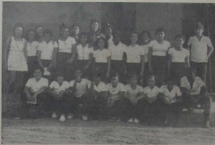
O grupo de alunos da 5ª série do C. E. I. N. I. reunido em frente às oficinas do CL, na Rua Luiza Lambert, 91.