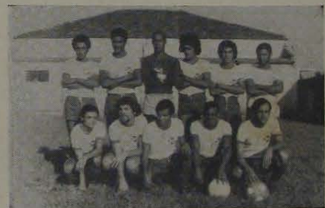
Após derrotar o Belford Roxo, a equipe do XV de Novembro assumiu a liderança invicta da Divisão Especial.

A partida deverá oferecer muita emoção, em virtude do gabarito das duas equipes.