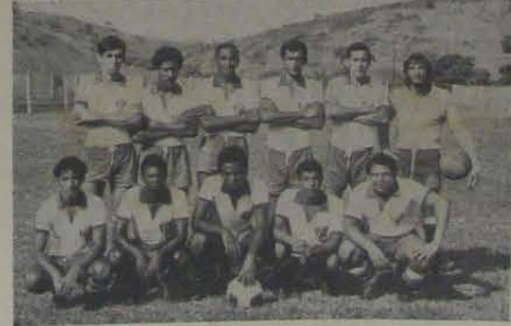
O excelente quadro da A. A. Banco de Areia é um dos cabeças de chave do Campeonato da Segunda Divisão.

juário 0, Guaraciaba 0 x Proletário 0 e Hinterland W x O Ipiranga.