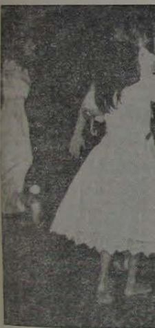
Danças folclóricas por alunas do Curso Normal, nas festas de aniversário do Instituto de Educação Santo Antonio.