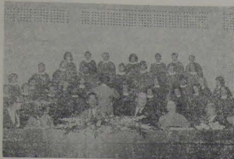
Aspecto da apresentação do Coral Gama Filho.

A presidência da solenidade coube ao Sr. Prefeito Municipal que, ao encerrá-la, teve palavras