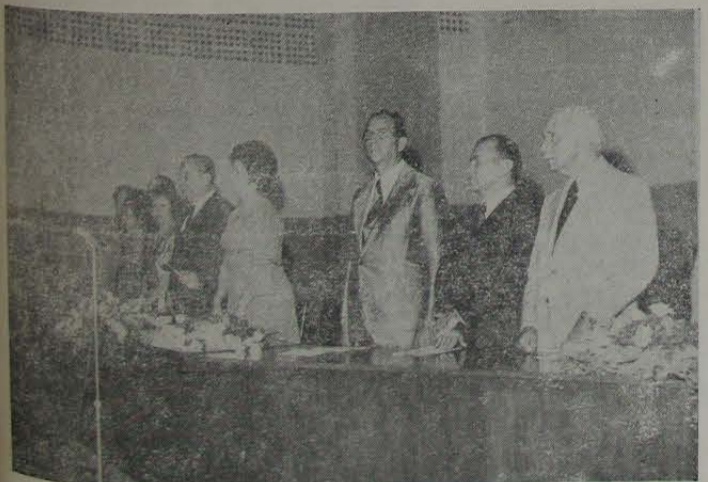
Parte da mesa que presidiu a solenidade.

Nossa reportagem, que já havia assistido, na véspera, solenidade idêntica, quando concluíram o curso ginasial cerca de duzentos e cinquenta alunos, apresentou à direção do Colégio suas congratulações pelo brilho com que foram realizadas as festas de formatura daquele tradicional estabelecimento, que completa para o ano, trinta anos de serviços à formação da infância e juventude de nossa terra.