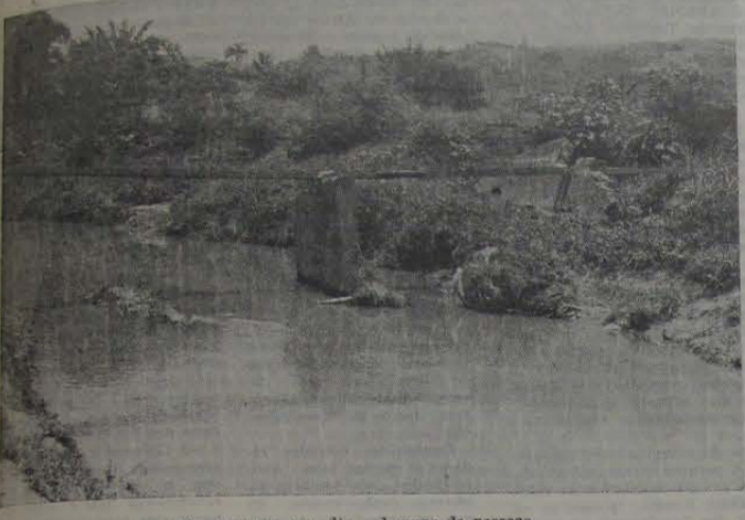
Por essa ponte de trilho passam, por dia, dezenas de pessoas.

Nova Iguaçu, um Município que cresceu desordenadamente, sem planejamento alguma, a mercê dos interesses de políticos inescrupulosos, apresenta-se hoje como um sério desafio às autoridades administrativas. O nosso crescimento demográfico trouxe encargos e responsabilidades acima da visão imediatista dos homens públicos que durante toda a nossa história colocaram os interesses de amigos e correligionários em primeiro plano. Tudo está por fazer. Milhares de ruas, estradas e avenidas intransitáveis. Escolas caindo aos pedacinhos, pouca ou nenhuma manutenção, falta de saneamento básico, policiamento, estradas, condução etc., há um descaso das autoridades públicas em per-