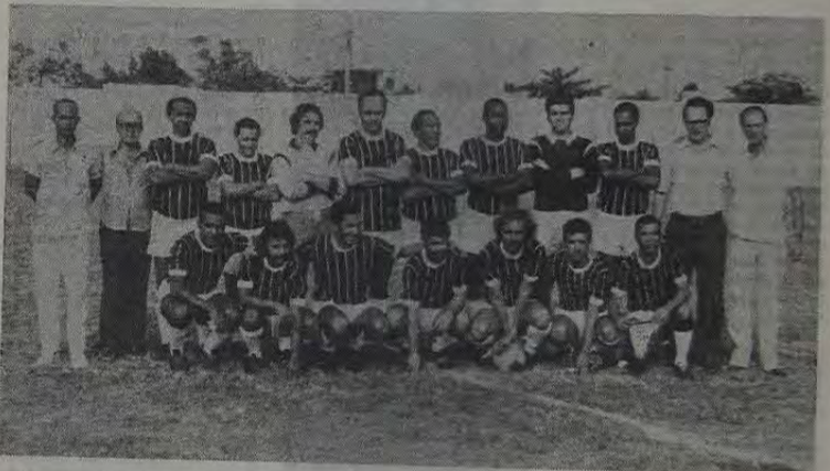
A equipe de veteranos do Mesquita Futebol Club.