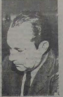
O Prefeito João Batista Barreto Lubanco (foto) estará aniversariando no próximo dia 12...