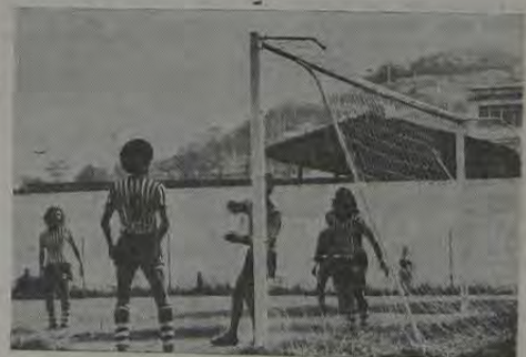
Lance do segundo gol do Everest.

O Torneio Integração Otávio Pinto Guimarães terminou amanhã, com a realização da última rodada do turno final. O Mesquita FC voltará ao Estádio Augusto Simões para enfrentar o Pavunense, enquanto o Volantes, mais uma vez se deslocará até a capital, onde enfrentará o Everest, no campo deste.