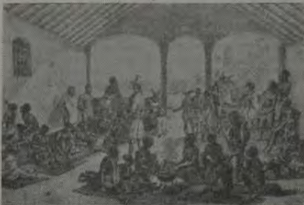
"Mercado de escravos" litografia de Rugendas tirada do livro "Voyage pittoresque dans le Brésil"

De qualquer forma, sem sombra de dúvida, Gregório é o nosso poeta da era colonial mais significativo.