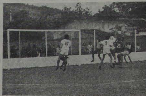
Lance do jogo realizado no Estádio José de Alvarenga, entre o Morro Agudo e o Heliópolis.