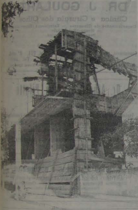
O madeirame do inacabado Edifício Falcão pode desabar a qualquer momento.