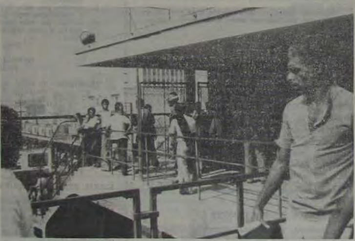
Durante todo o dia de terça-feira a estação de Nova Iguaçu esteve fortemente poluída, mesmo sem ter ocorrido aqui os graves incidentes que tiveram lugar em Olinda e Nilópolis, por exemplo.

Na última terça-feira, várias estações da Estrada de Ferro Central do Brasil, do ramal de Japeri, amanheceram com sua habitual rotina alterada. Tremes parados, cabines quebradas, povo desorientado e revoltado, soldados, PMs e os curiosos, de sempre criaram um clima de tensa expectativa nos habitantes de Nova Iguaçu. Presidente Juscelino, Mesquita, Olinda e Nilópolis. Vários comentários surgiram e se desfaziam na boca do povo e as "edições extraordinárias" se sucediam nas rádios procurando esclarecer as causas; do grave incidente que chegou até mesmo a provocar notas apressadas e ridículas do Presidente da Rede Ferroviária Federal e do Ministro dos Transportes, General Dirceu Nogueira.