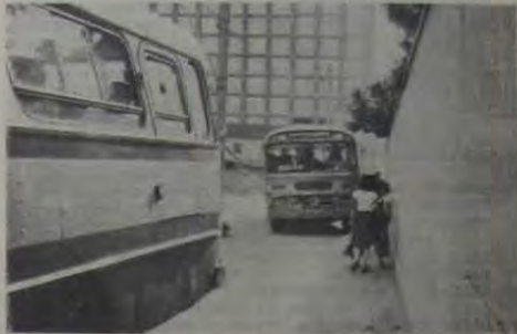
Os ônibus passam por cima da calçada na Rua Treze de Maio ameaçando escandalosamente a segurança dos pedestres.

Está o aspecto parcial da ineficácia de um setor tão importante como é o do Juizado de Menores, mas, que, infelizmente, tem à frente uma autoridade que ao invés de apelar para a imprensa sobre a carência de recursos à sua disposição, mobilizando a sociedade local numa ajuda comunitária, optou-se de maneira grosseira e indelicada à ação daqueles que têm o dever de informar e propor soluções.