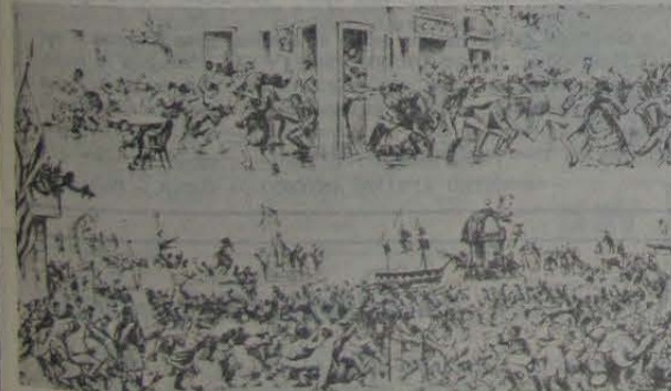
O Entrudo, litografia de: Angelo Agostini tirada da Revista Ilustrada, Biblioteca Nacional, Rio.

O universo evasivo da cultura de massa brasileira é realmente o do velho jogo oral, recriado pela offset ou pelo olho eletrônico das câmaras.