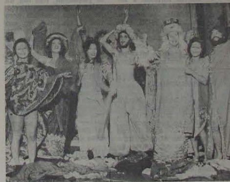
O grupo Areia se apresenta hoje e amanhã no Teatro Arcádia