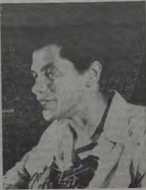
PAULINHO DA VIOLA