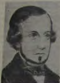
Nascido em 1799, Almeida Garret, além de ser

a mais complexa figura do romantismo português, foi político representativo do liberalismo, tendo lutado pela implantação do constitucionalismo em Portugal. As suas primeiras obras mostram ainda sob a influência dos arcaísmos ("Lírica de João Minimo", 1829), mas já desde os poemas narrativos "Camões" (1825) e "D. Branca" (1826) se manifestam na sua obra as tendências liberais e românticas. Estas ganham expressão definitiva nas obras teatrais "Um Acto de Gil Vicente" (1838) e "O Alfageme de Santa-