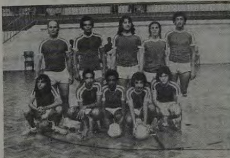
Equipe de Voleibol do Colégio Gonçalves Dias.