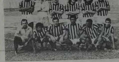
A equipe da Mesquita F.C.