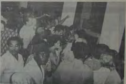
O acúmulo de pessoas procurando o rápido atendimento é uma constante na arrecadatória da Secretaria de Fazenda.

Várias foram as reclamações que chegaram ao nosso conhecimento sobre o atendimento na Secretaria de Fazenda. Esta semana, para constatar "in loco" o problema, estivemos observando o movimento de pagamento de impostos naquela importante repartição da Municipalidade.