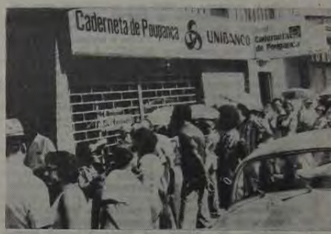
Generalizado tumulto se formou esta semana em frente à agência do UNIBANCO pelos depositantes afilios da FINANCILAR.