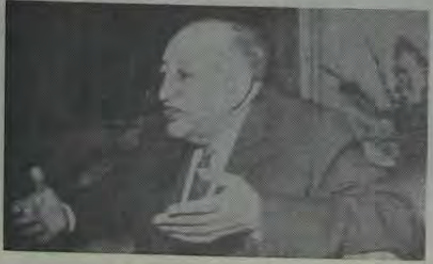
MIGUEL ANGEL ASTURIAS

Para as regiões da América negra pode-se tentar este mesmo agrupamento a partir dos textos em "creole" ou em línguas oficiais, pela mesma percepção do uso de um "imaginário" social que apresente um repertório a fim de soluções literárias. Mas, por outro lado, pode-se introduzir uma distinção entre línguas literárias frequentemente associadas sem um e mesmo conteúdo, e possível distinguir entre uma criatividade folclórica, popular, anônima, tradicional, e uma criatividade individual que se alimenta da primeira, mas que implica o reconhecimento das operações da invenção culta, e ao mesmo tempo leva em conta a existência de um mundo cultural latino-americano.