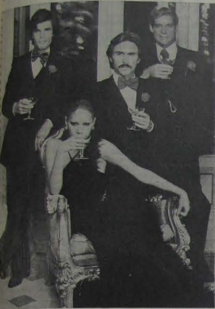
Integrando-se na Moda Masculina, Rosalém Roupas está presente com sua etiqueta, no Baile das Debutantes do Nova Iguaçu Country Club, a realizar-se dia 18, às 23 horas. Na foto, a elegância do homem atual, uma especialidade Rosalém.