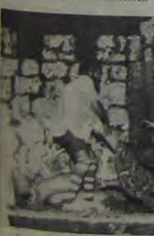
Uma cena de "Piquenique no Front", em cartaz no Teatro Arcádia.

Esta em cartaz no Teatro Arcádia a peça teatral "Piquenique no Front", de Fernando Arrabal.