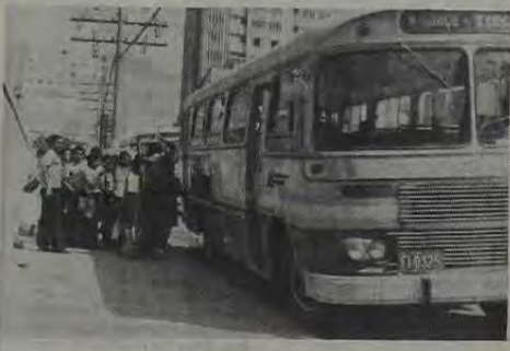
A política de concessões de linhas de coletivos em Nova Iguaçu é vergonhosa. No setor, tudo é permitido, desde que favoreça aos empresários. Só não se considera o interesse da população.

Nova Iguaçu está colorida entre os primeiros municípios brasileiros em número de concessões de linhas de ônibus. Empresas de transportes coletivos proliferam em linhas municipais, interestaduais, municipais e interestaduais. Aqui e ali, o que podemos chamar de "o paraíso dos ônibus" de todos os transportes coletivos. Todas as linhas que