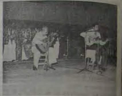
Paulinho da Viola e seu pai, na roda de samba promovida no ECI, em maio deste ano.

Mas tudo isso ainda é reflexo das rodas de samba, onde o partideiro, não raro, é explorado e se contenta com um magro cachê que lhe é imposto. Não há a união da classe, porque não há classe ainda. Isso não quer dizer que os compositores que se apresentam em rodas de samba não tenham o seu valor. Têm e têm o seu talento desvalorizado, isso sim. Tem aparecido muita gente boa nessas rodas de samba e, em razão do problema exposto, muita gente boa também tem se afastado (v. Paulinha da Viola, que não concorda com a má remuneração desses compositores). Para ele e para outros sambistas mais conscientes há uma relação humilhante entre o partideiro e essas casas de samba.