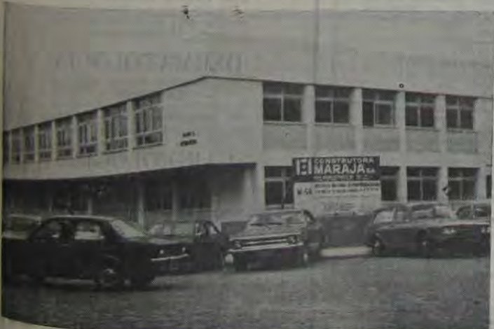
As novas instalações do INPS indicam que os serviços previdenciários em Nova Iguaçu caminham no sentido de satisfazer, em termos de atendimento, a grande massa de segurados, que residem no Município.