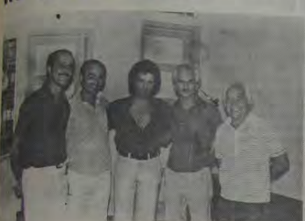
A apresentação de Roberto Carlos no Esporte Clube Iguaçu no último dia 6 revestiu-se de grande êxito. Na foto vemos o "rei" Roberto Carlos junto com a atual diretoria do ECI. (Foto exclusiva para esta coluna.)