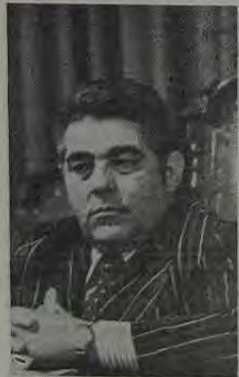
Mauro defende a convocação de Joaquim de Freitas e Lubanco para falarem sobre o Centro Administrativo na Câmara, mas ao mesmo tempo acha que o Prefeito deve erigir o Paço Municipal no terreno onde antes funcionava a garagem da Prefeitura.

Em Volta Redonda, de outro lado, através de articulação com o INPS e obras sociais particulares existentes na cidade, será instalado um Núcleo de Ação Comunitária, dentro da política da LBA de mobilizar as comunidades do País para o campo do atendimento social.