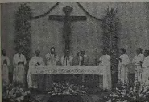
Flagrante da missa solene em louvor ao Santo Padroeiro da cidade, celebrada às 10 hs. do dia 13, na Catedral de Santo Antônio.

Nos quatro dias de funcionamento, a Festa contou com grande número de pessoas, que tomaram boa parte da Avenida Marechal Floriano.