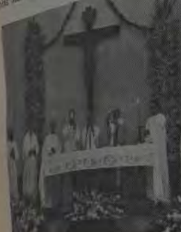
Festa de Santo Antônio em honra ao Senhor São Antônio, realizada no dia 13, na igreja local.

Contando com a participação de abnegados membros da comunidade local, a Festa de Santo Antônio de Nova Iguaçu, realizada no Município, obteve sucesso absoluto. Organizada e realizada por Dom Adriano M. de S. S. a Missa celebrada por Dom Adriano M. de S. S. a que compareceu grande número de fiéis. O programa da festa foi muito animado e contou com a participação de diversas bandas de música, além de jogos e brincadeiras para as crianças. A festa foi um sucesso absoluto e contou com a participação de muitos amigos e familiares. A festa foi muito agradável e contou com a participação de muitos amigos e familiares. A festa foi muito agradável e contou com a participação de muitos amigos e familiares.