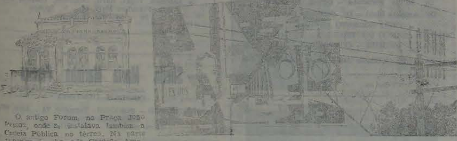
O antigo Fórum, na Praça João Pessoa, onde se instalava também a Caixa Pública de lotes. Na parte superior do chamado Casarão Amarelé é que funcionava o Fórum e, no salão principal, o Tribunal do J.º