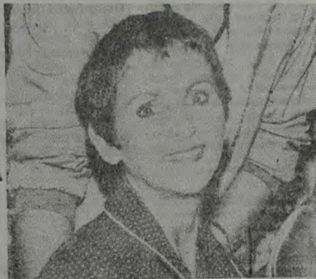
IDY MAÍDE RAUNHEITTI