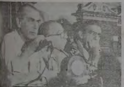
Em sua mensagem enviada à Assembleia, Brizola define-se por um aumento de igual percentual para todos os policiais

dos do governo vêm tratando os trabalhadores que fazem greve: bancários, ferroviários. Pouco ou quase nada foi dito sobre a função dos constituintes. A unanimidade entre três debatedores foi conseguida em dois pontos: para eles o mandato do Presidente José Sarney deve ser no máximo de quatro anos. Já Salões lembra a posição do PT que quer eleições diretas já. 'Nós nem reconhecemos a legitimidade do mandato do Sarney', explica. A necessidade de uma anistia ampla, geral e irrestrita para os cassados pelos atos institucionais da ditadura também foi ressaltada por todos. Walter Faria Pacheco procurou responder as perguntas de forma rápida, dando a entender que pouco tinha a dizer enquanto candidato.