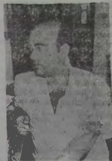
MAIS FORTE QUE O DÓLAR

"Durante muitos anos a população brasileira viveu em autêntico inferno astral com os preços subindo escandalosamente e o poder de compra dos salários em queda livre. De fato, a inflação, nos últimos anos, destruiu o poder aquisitivo dos assalariados, determinando o vertiginoso empobrecimento da população e o consequente aumento da criminalidade, da violência, da miséria absoluta e da mendicância".