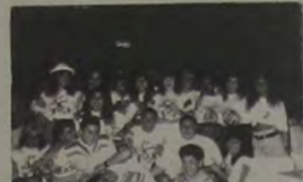
A turma divertida e animada do Rancho Novo, a postos para a festa no Esporte Clube Iguazu dia 20: show com Elymar Santos e Banda Assim Somos Nós