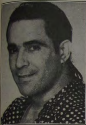
Elymar Santos será a atração especial no Esporte Clube Iguazu, dia 20 de janeiro, sexta-feira

Tudo esquematizado para o super-show de Elymar Santos e Banda Assim Somos Nós, dia 20, no Esporte Clube Iguazu.