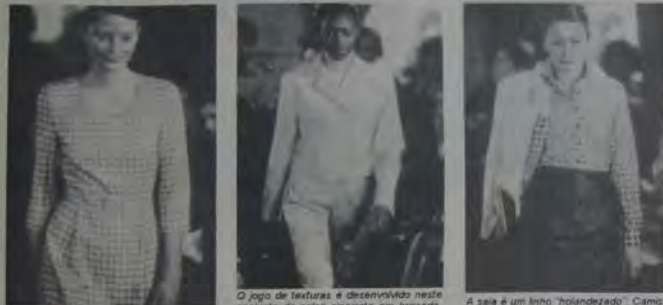
Dentro da tendência Jackie, o vestido em malha de lá e seda