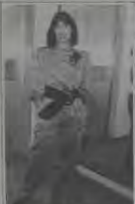
Rita: macacão de crepe cinza com cinto preto como detalhe