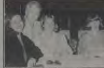
Outra atração da festa: o buffet preparado por Mr. Pierre, escalopinho ao molho Chandon com champignons, arroz com nozes e passas e batata à francesa. Uma delícia! O chopp foi Brahma e os refrigerantes da Temp, naturalmente.